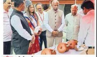
नाशिक : स्टॉली घाहणी करताना मान्यवर.