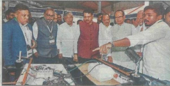
Union agriculture minister Shivraj Singh Chouhan with chief minister Devendra Fadnavis on Tuesday

Calling Maharashtra the horticulture hub of the country, he said during his re-