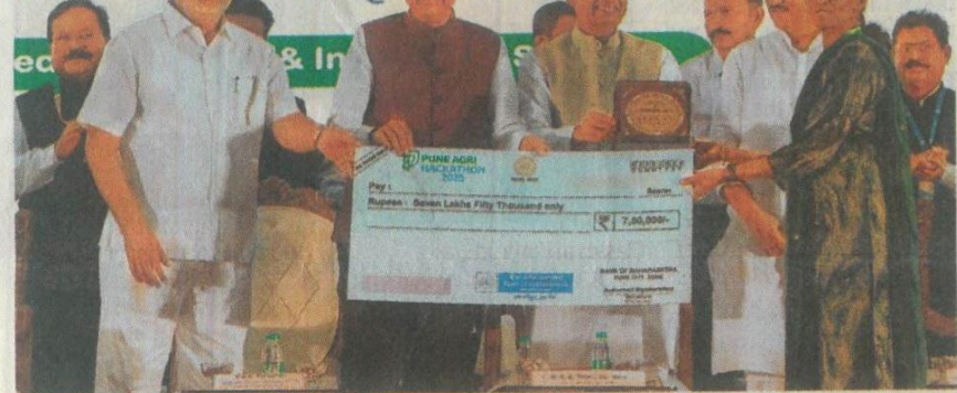
Chief Minister Devendra Fadnavis, Union minister Shivraj Singh Chouhan and Deputy Chief Minister Ajit Pawar present a cheque to the runner-up of the hackathon on Tuesday.