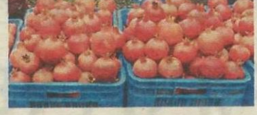
जिल्ह्यातून झालेली डाळिंबाची निर्यात दृष्टीक्षेप