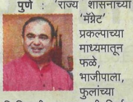
पुणे : 'राज्य शासनाच्या 'मॅग्रेट' प्रकल्पाच्या माध्यमातून फळे, भाजीपाला, फुलांच्या

विक्रीसाठी एक साखळी निर्माण करण्यात येणार आहे. जागतिक पातळीवर सर्वात मोठी कृषी उत्पन्न बाजार समिती राज्यात निर्माण करण्यात येणार आहे. जल, रेल्वे, वाहतूक, विमानतळ, तसेच महामार्गांशी ही बाजारपेठ जोडण्यात येणार आहे, अशी माहिती पणन मंत्री जयकुमार रावल यांनी शनिवारी दिली.